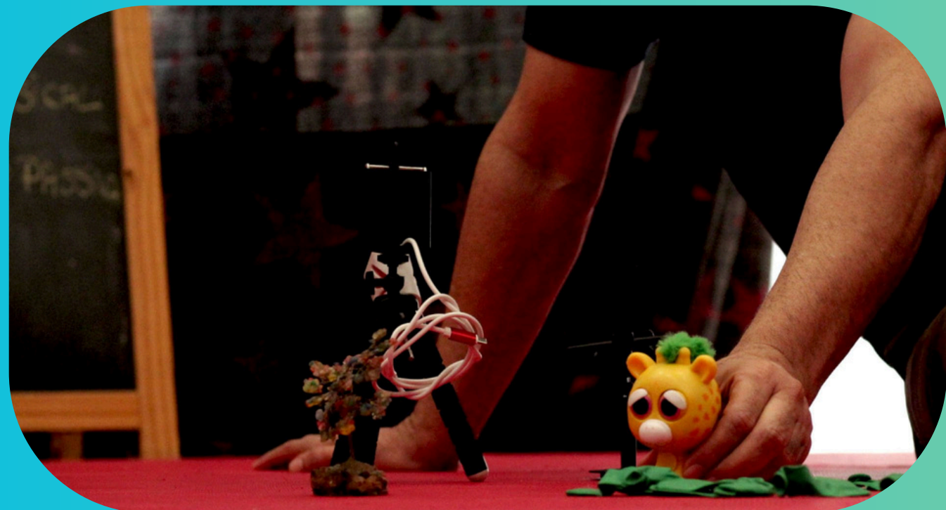
CONTAÇÃO DE HISTÓRIAS