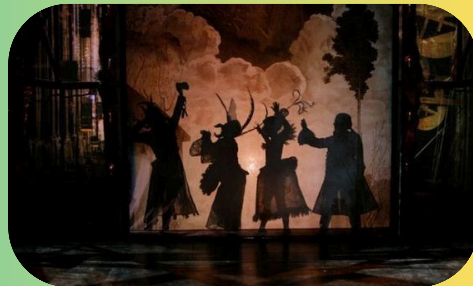
TEATRO DE SOMBRAS E OUTRAS LINGUAGENS