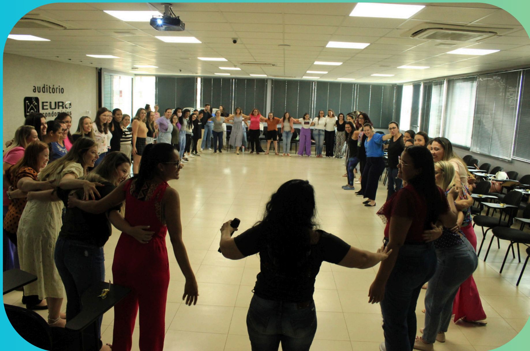
EXPRESSÃO CORPORAL E VOCAL